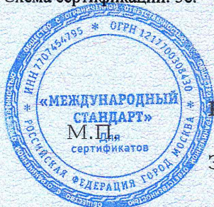
Схема сертификации: Зс.