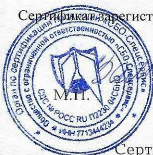
Схема сертификация 1с

Сертификат зарегистрирован на сайте СДС № РОСС RU.П2230.04СБН0 www.sbosspr.ru