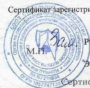
Схема сертификации 1с

Сертификат зарегистрирован на сайте СДС № РОСС RU.П2230.04СБН0 www.sbosspr.ru