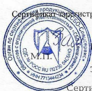
Схема сертификация 1с

Сертификат зарегистрирован на сайте СДС № РОСС RU.П2230.04СБН0 www.sboss.ru