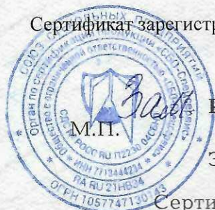
Схема сертификации 1с

Сертификат зарегистрирован на сайте СДС № РОСС RU.П2230.04СБН0 www.sboss.ru